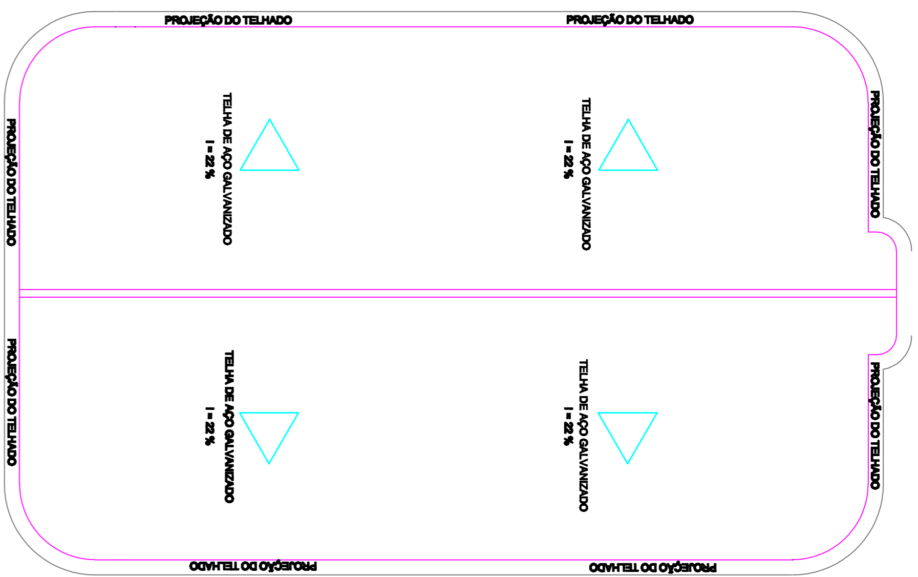
PLANTA DE COBERTURA ESCALA 1:200